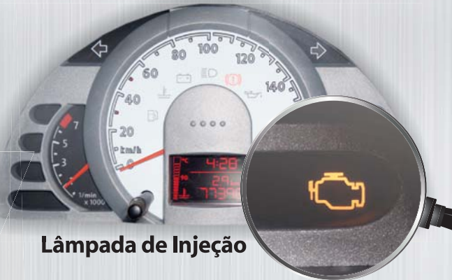
Lâmpada de Injeção

Após a substituição do sensor de oxigênio devemos limpar os parâmetros auto adaptativos, desta forma o sistema de injeção irá iniciar o aprendizado com o sensor novo.