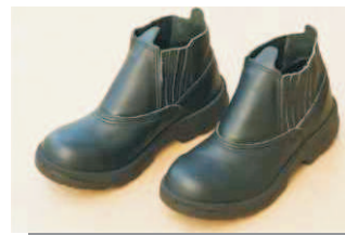
Bota de segurança

2. Outro fator importante para o bom resultado do assentamento das pastilhas de porcelana são as ferramentas necessárias para o trabalho.