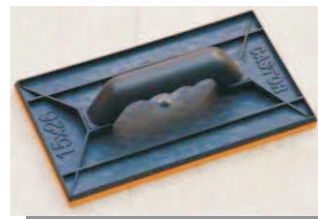
Desempeneira de Borracha