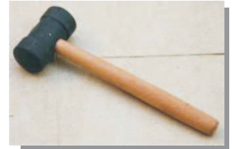
Martelo de borracha