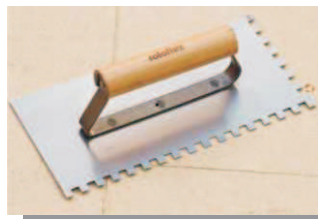
Desempeneira de 6x6x6 ou 8x8x8 mm