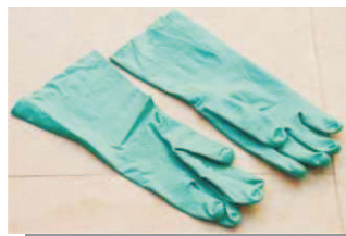
Luvas de borracha