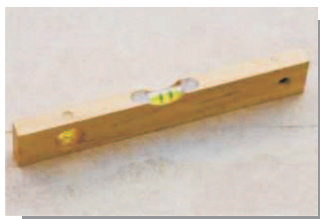
Nível de mão