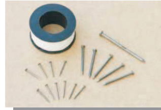
Pregos e linha