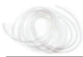
Mangueira de nível