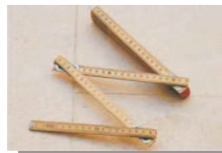
Metro ou trena