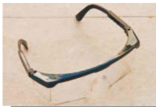
Óculos de segurança