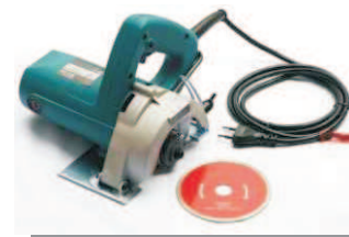
Serra para Porcelanato / Cerâmica